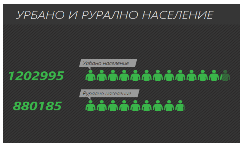
Слика 1: УРБАНО И РУРАЛНО НАСЕЛЕНИЕ ВО РЕПУБЛИКА МАКЕДОНИЈА ВО 2017 ГОДИНА, СПОРЕД ПРОЦЕНИ НА НАСЕЛЕНИЕ ПРИКАЖАНИ ВО БАЗАТА НА ПОДАТОЦИ НА СВЕТСКА БАНКА

Според податоците од базата на податоци на Светска Банка, 42,25% од вкупното население во Република Македонија во 2017 година или 880.185 жители од вкупно проценети на 2.083.160, живееле во рурални средини (слика 1).