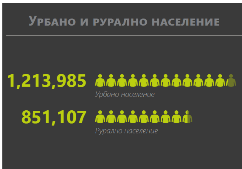
Слика 1: УРБАНО И РУРАЛНО НАСЕЛЕНИЕ ВО РЕПУБЛИКА СЕВЕРНА МАКЕДОНИЈА ВО 2022 ГОДИНА

Според податоците од базата на податоци на Светска Банка, 41% од вкупното население во Република Северна Македонија во 2021 година живее во рурални средини (слика 1), наспроти 42% во 2017 година (претходен плански период).