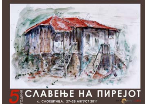
5 ГОДИНИ СЛАВЕЊЕ НА ПИРЕЈОТ с. СЛОЕШТИЦА, 27-28 АВГУСТ 2011

Projekti, si mesazh për të gjithë, ishte ekspozuar në mes të fshatit gjatë jubileut "FESTIMI I PIREUT" që ishte mbajtur më 28 gusht, në ditën e Shën Mërisë, mbrojtëses së fshatit!